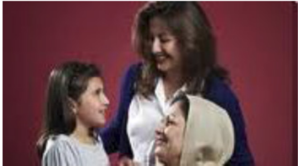
የፓፕ ምርመራ እና የማህፀን ጫፍ ምርመራ

ቀጥሎም ከቻሉ ለምርመራው እንዲነሱ ይጠየቃሉ። ጡትዎ በማሞግራፍ መሳሪያው ላይ ተቀምጦ ጠንከር ያለ ግፊት ይደረግበታል። ምርመራው ትንሽ ምቹት የማይሰጥ ሊሆን ይችላል ነገር ግን ማንኛውም ምቹት ማጣት ራጅ እስከሚነሳና ለአንድ ደቂቃ ላልበለጠ ጊዜ የሚቆይ ነው።