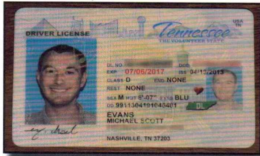
گواهی نامه رانندگی

برای وقت های ملاقات با پزشک، موارد زیر را همراه بیاورید: